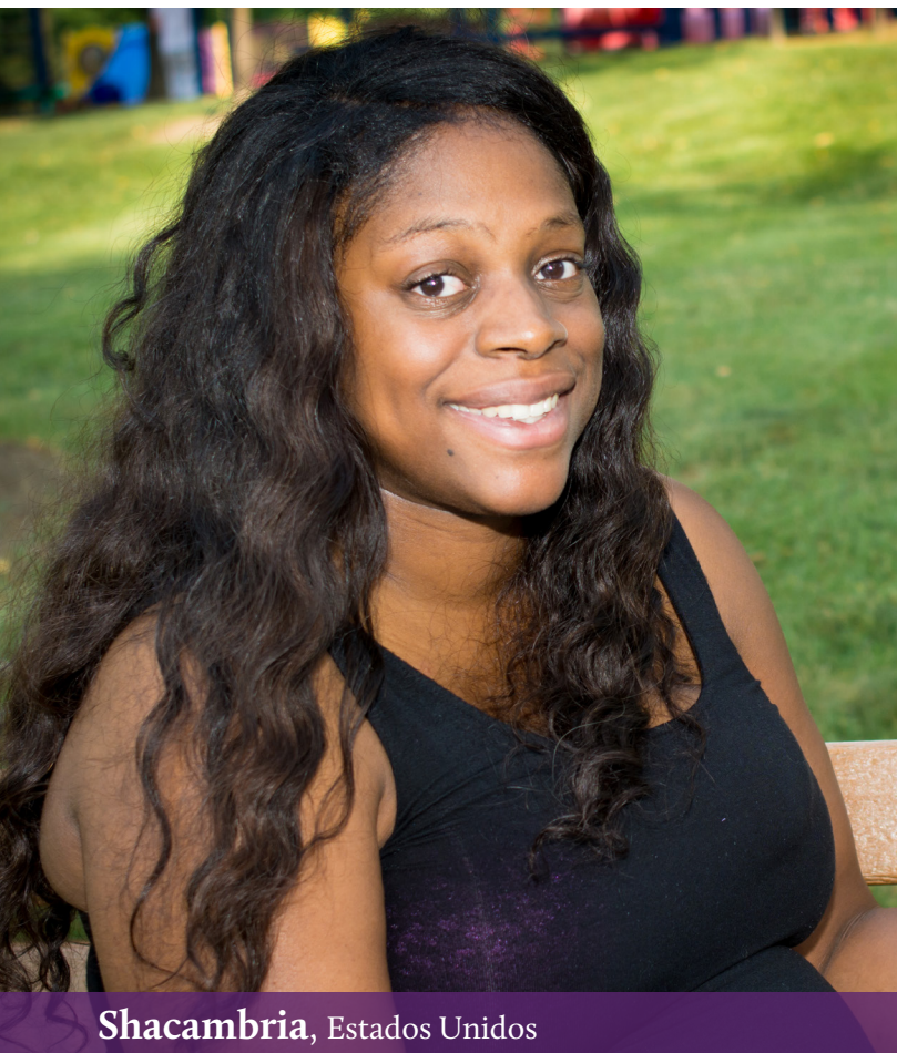
Shacambria, Estados Unidos