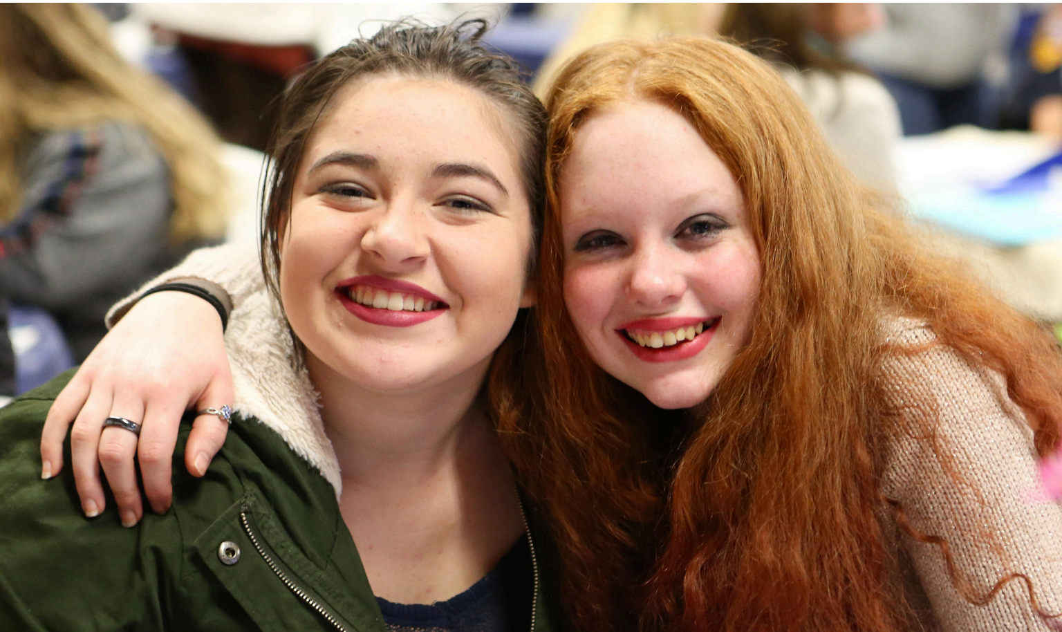
Participantes de Suéñalo, Puedes Lograrlo , USA

Nuestro nuevo programa, Suéñalo, Puedes Lograrlo: Apoyo de Carrera para Jovencitas ® , les ha brindado a más de 50.000 niñas vulnerables en la escuela secundaria el apoyo que necesitan para cumplir sus sueños profesionales. El apoyo incluye tutoría, plantear metas, herramientas para superar los contratiempos y planificación profesional.